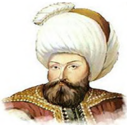
السلطان سليم الأول